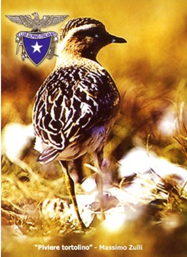
"Piviere tortolino" - Massimo Zulli