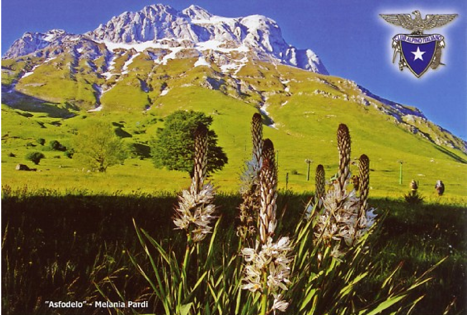
"Asfodelo" - Melania Pardi