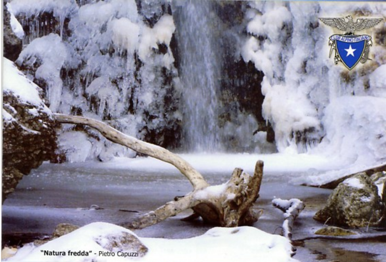
"Natura fredda" - Pietro Capuzzi

2 gennaio 2011 - GRAN SASSO D'ITALIA (Parco d'Inverno)