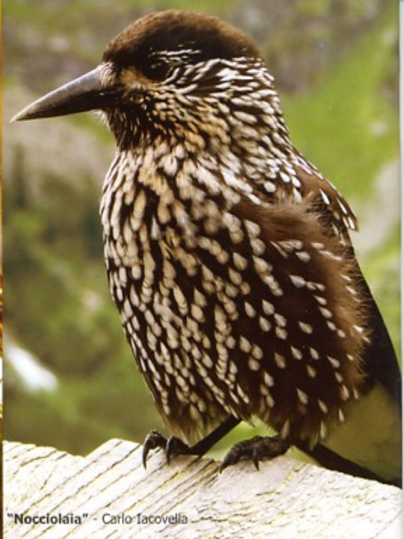
"Nocciolaia" - Carlo Tacovella