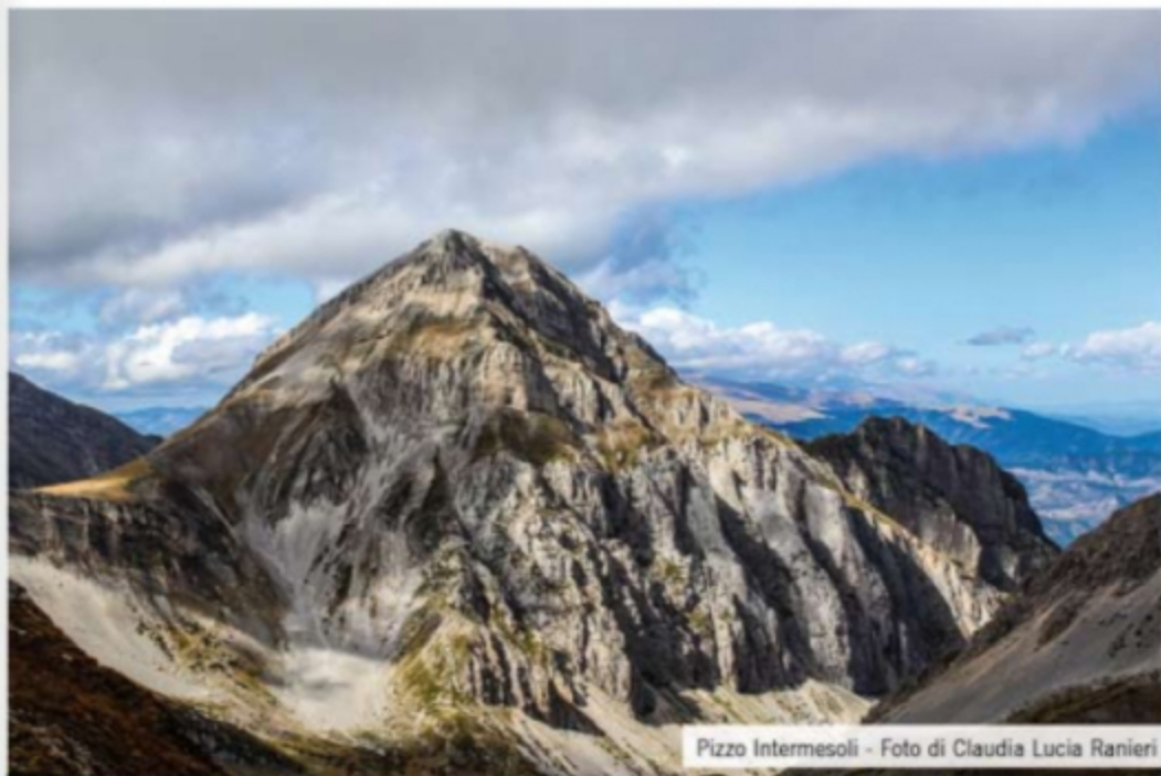
Pizzo Intermesoli

DIAMOCI GLI AUGURI DI FINE ANNO SULLA NEVE