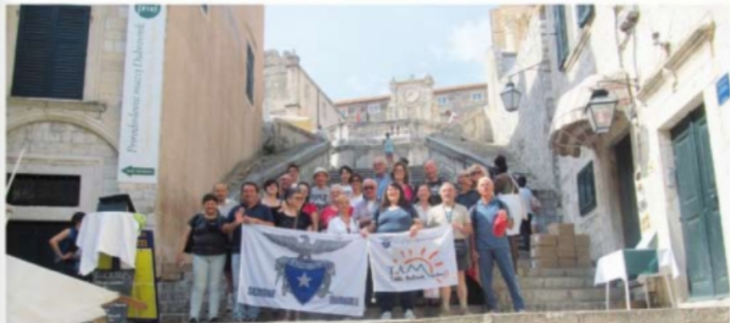
Settimana Verde 2017 Dubrovnik