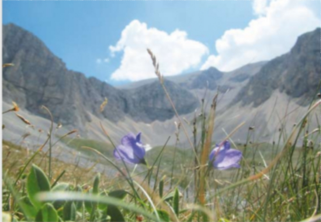
Anfiteatro delle Murelle