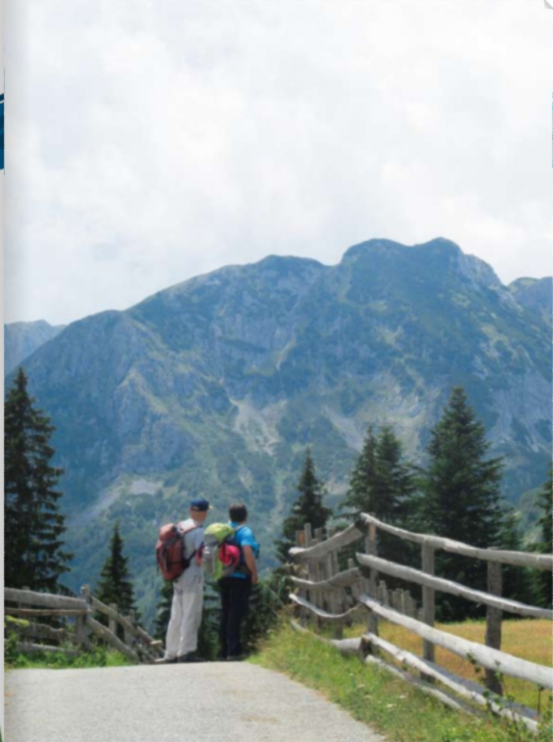
PARCO del DURMITOR, MONTENEGRO