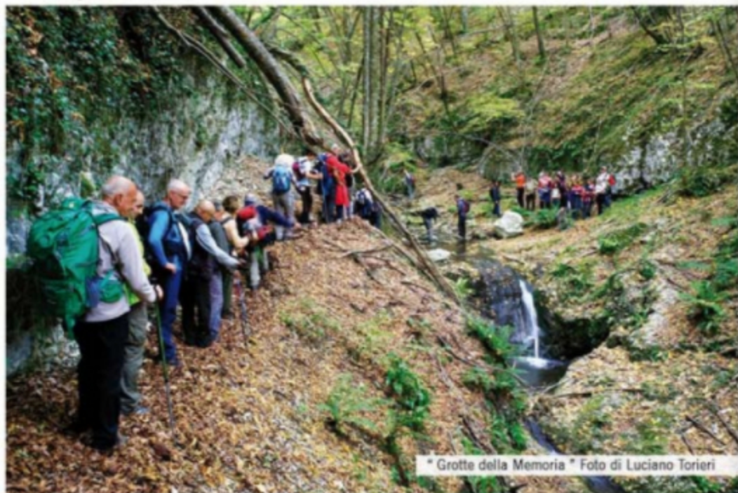
* Grotte della Memoria *