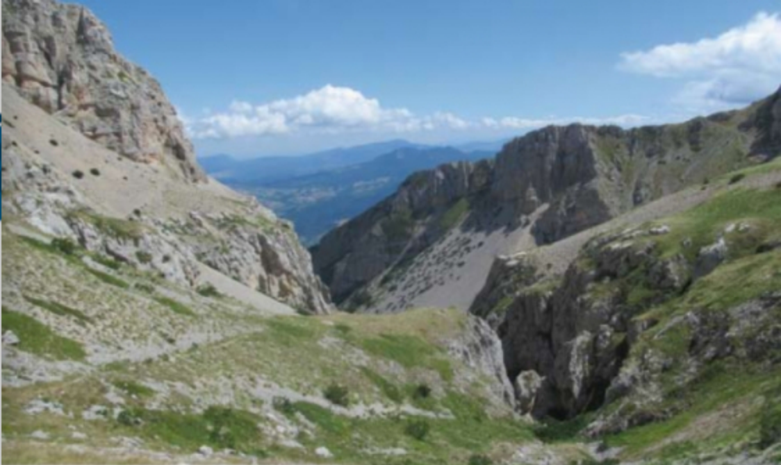
La Valle di Taranta