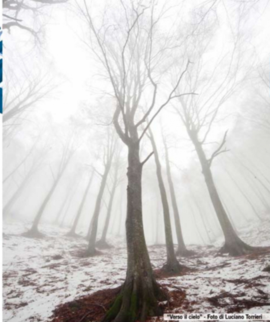
"Verso il cielo"