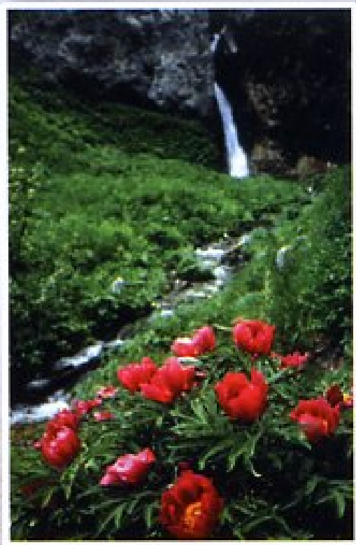
Parco Nazionale della Maiella "Valle dell'Orfento"