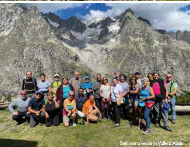
Settimana verde in Valle d'Aosta