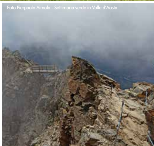
Settimana verde in Valle d'Aosta